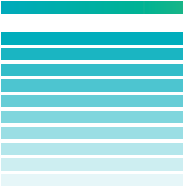
Pantone 360 C

El color es un componente fundamental de la identidad visual de Posgrado en Biología Experimental y contribuye de manera esencial a sistematizar sus comunicaciones. Como color corporativo se ha elegido el: Pantone 360 C Pantone 7466 C. Para garantizar la correcta reproducción de la marca en diferentes soportes.